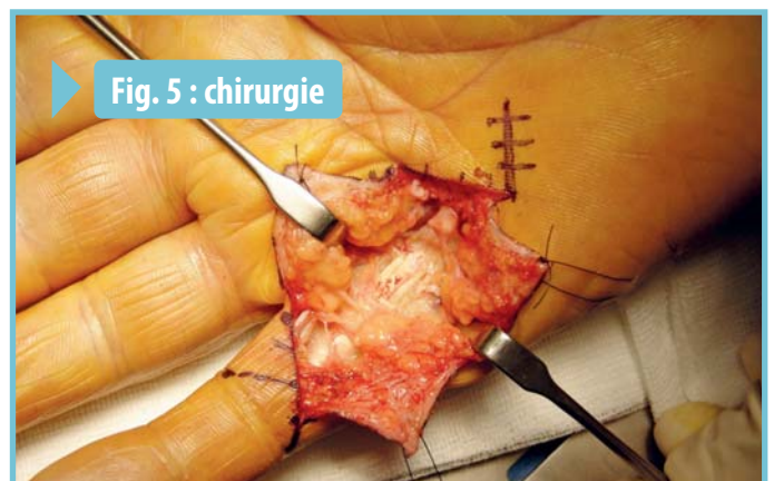
Fig. 5 : chirurgie

Aujourd'hui, un traitement médical (injection de collagénase) est disponible dans certains pays occidentaux, il permet de dissoudre les brides sans chirurgie. Bien qu'agrée en France, il n'est pas encore disponible en raison de son coût.