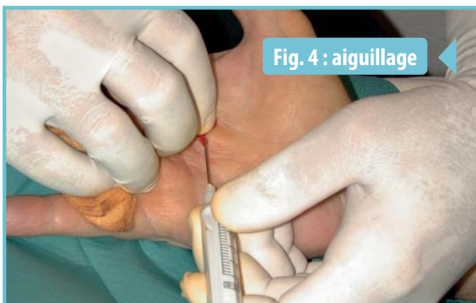
Fig. 4 : aiguillage